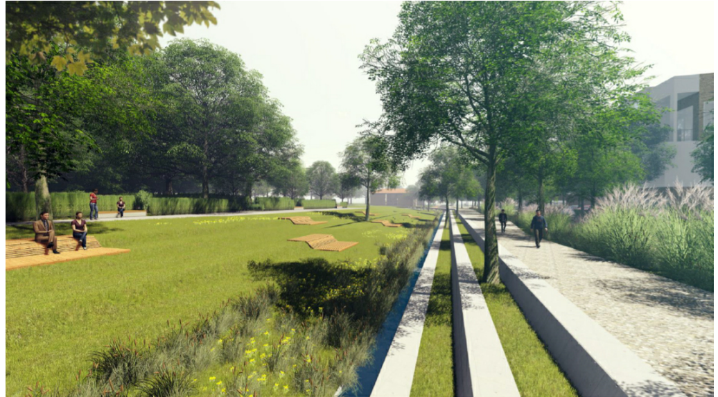
Abbildung 3: Visualisierung der Promenade mit der offen geführten Gracht (Abbildung: Ramboll Studio Dreiseitl)

Höhe bis hin zum Einlaufbauwerk in den Harpener Bach am östlichen Ende des Plangebietes.