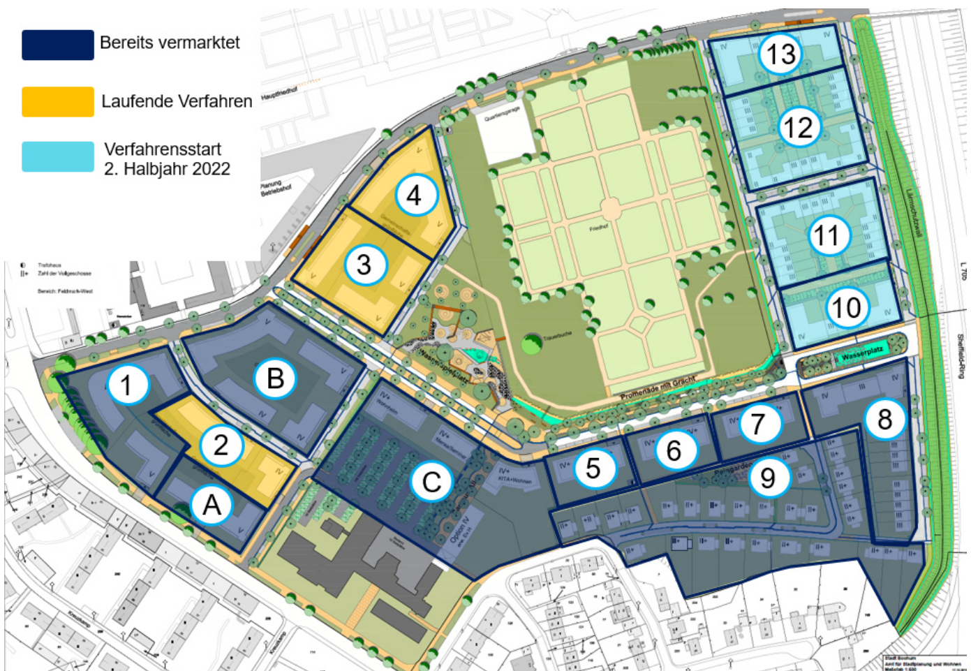
Abbildung 7: Vermarktungsabschnitte im Quartier Feldmark

Das Vermarktungskonzept für das Quartier Feldmark sieht grundsätzlich eine kleinteilige Vermarktung vor. Bei der kleinteiligen Vermarktung wird davon ausgegangen, dass sich unterschiedliche Investierende mit verschiedenen Architekturbüros und inhaltlichen Schwerpunkten auf die Grundstücke bewerben. Es ist jedoch möglich, dass sich Investierende in mehreren Bestgebotsverfahren bewerben – auch für Bauabschnitte, die nebeneinanderliegen. Eine Wiederholung von Gestaltungselementen entspricht aber nicht dem im Quartier Feldmark verfolgten Ziel der architektonischen Vielfalt. Im Falle einer Bewerbung auf zwei benachbarte Vermarktungsabschnitte muss daher nachgewiesen werden, dass die Gestaltung und Nutzungskonzepte bezüglich Bautypologie und Fassadengestaltung wirken, als seien unterschiedliche Investierende und Architekturbüros am Werk.