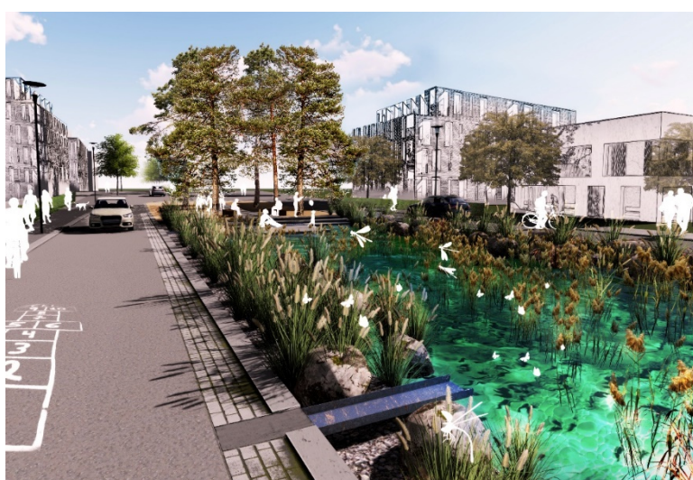
Abbildung 6: Visualisierung des Wasserplatzes (Abbildung: Ramboll Studio Dreiseitl)

Die Promenade beginnt am Quartiersplatz und verläuft entlang der Gracht und der Haupteerschließungsachse weiter bis zum Wasserplatz. Sie lädt mit ihren Wegen und begleitenden Rasenterrassen zum Verweilen, Flanieren und Begegnen ein. Ein weiteres Freianlagenelement mit dem Thema Wasser ist der Raingarten, der zwischen der Promenade und den Häusern am Eichendorffweg entsteht. Eingebettet in die umliegende Bebauung dient er als öffentlicher Freiraum zur Begegnung und übernimmt gleichzeitig funktionale Anforderungen der Regenwasserbewirtschaftung.