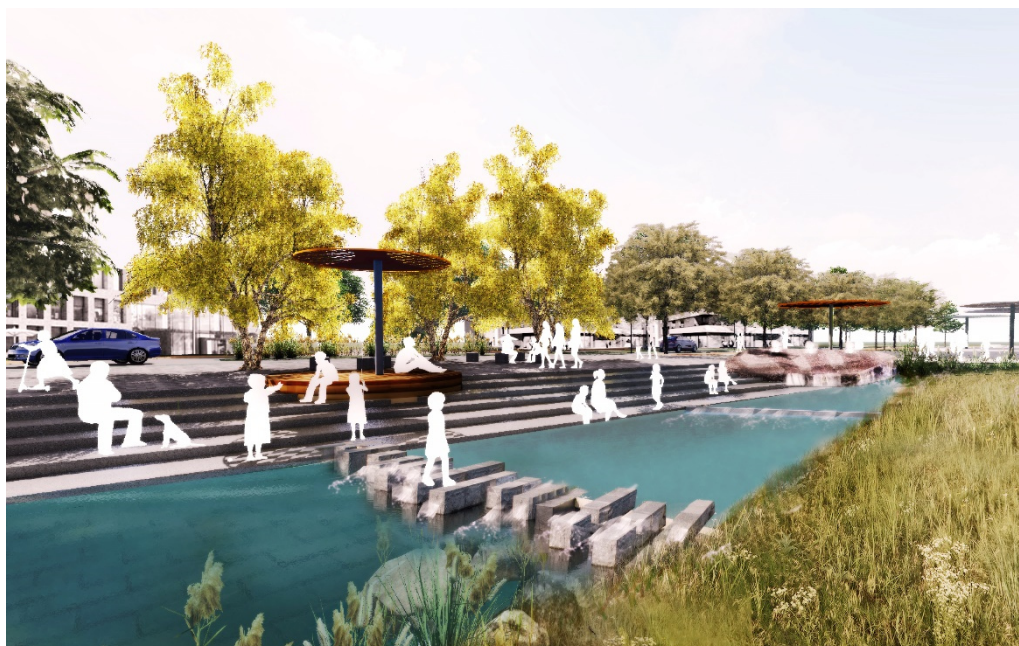
Abbildung 5: Visualisierung des Quartiersplatzes (Abbildung: Ramboll Studio Dreiseitl)

Die Promenade beginnt am Quartiersplatz und verläuft entlang der Gracht und der Haupteerschließungsachse weiter bis zum Wasserplatz. Sie lädt mit ihren Wegen und begleitenden Rasenterrassen zum Verweilen, Flanieren und Begegnen ein. Ein weiteres Freianlagenelement mit dem Thema Wasser ist der Raingarten, der zwischen der Promenade und den Häusern am Eichendorffweg entsteht. Eingebettet in die umliegende Bebauung dient er als öffentlicher Freiraum zur Begegnung und übernimmt gleichzeitig funktionale Anforderungen der Regenwasserbewirtschaftung.