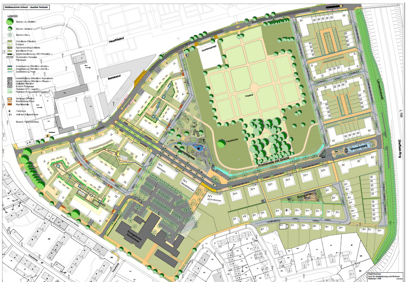
Abbildung 1: Städtebaulicher Entwurf Quartier Feldmark

Das Quartier Feldmark ist das westliche Quartier des Projektes OSTPARK – Neues Wohnen. Es entsteht im Stadtteil Altenbochum auf Brachflächen der ehemaligen Stadtgärtnerei und wird begrenzt durch die Immanuel-Kant-Straße im Westen, die Straße Feldmark im Norden, den Sheffield-Ring im Osten und die Siedlung am Eichendorffweg im Süden. Geplant ist ein ökonomisch werthaltiges und sozial durchmischtes Quartier mit einem hohen ökologischen Standard und einer besonderen Gestaltungsqualität. Dabei sind die bestehende Evangelische Hochschule an der Immanuel-Kant-Straße sowie der Friedhof Altenbochum die zentralen Impulsgeber für das städtebauliche Grundgerüst. Zudem berücksichtigt das städtebauliche Konzept die zum Teil starken Höhenunterschiede des Geländes (West-Ost-Gefälle).